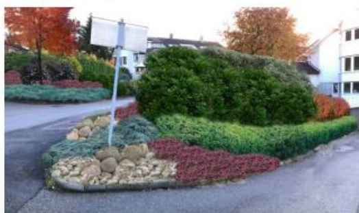
Konsept 2 – felt med steiner, enklere beplantning