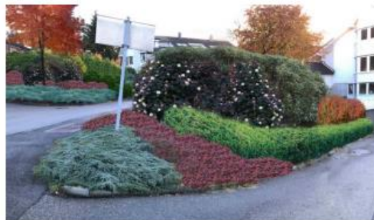
Konsept 1 – kun planter